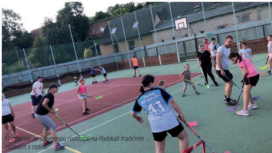
Florbalisté se se sezónou rozloučili na Podskalí tradičním zápasem s rodiči.