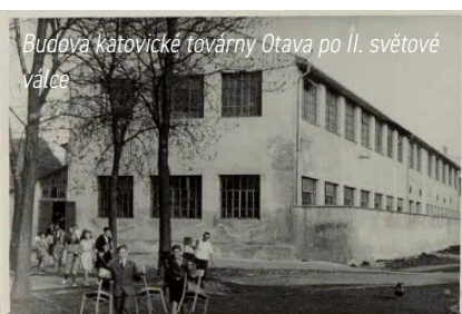
Budova katovické továrny Otava po II. světové válce