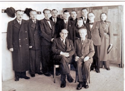
Pozvání hosté při slavnostním otevření měšťanské školy