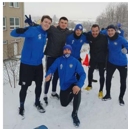
Katovičtí fotbalisté absolvovali v rámci zimní přípravy tradiční soustředění v Soběšicích.