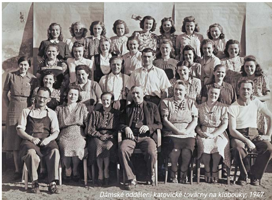
Dámské oddělení katovické továrny na klobouky; 1947