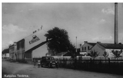
Pohlednice katovické továrny na klobouky Otava; 30. léta 20. století

Avšak přišla německá okupace. Tím, že Nový Jičín a další kloboučnické továrny připadly říši, protože se nacházely v Sudetech, staly se Katovice na krátkou dobu největší protektorátní továrnou na klobouky. Nakoupily se nové stroje, upravily se budovy. Brzy nastal problém s nedostatkem surovin, hlavně vlny. Musely se zavírat některé provozny, jako výroba štumf. Firma pak hlavně opravovala starší klobouky. Následně byla výroba ukončena, mnohé stroje odmontovány, továrna poničena. Budovy se začaly využívat na opravu vojenských oděvů, čepic a ke zhotovování slaměných strážních bot. Koncem války sloužila továrna jako objekt k ukládání říšskoněmeckých součástek na letadla a měla tu být dokonce zavedena výroba zápalných bomb, k čemuž naštěstí už nedošlo.