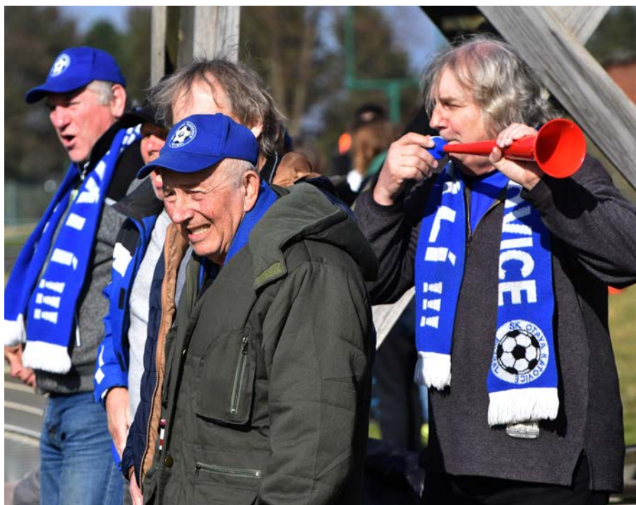
Divizní fotbalisté SK Otava Katovice budou spoléhat na své fanoušky, kteří jsou jejich dvanáctým hráčem. Ostatně to dokázali i v Příbrami, kam jich hráče vyrazilo podpořit na šest desítek.

• 16. kolo, sobota 15. června od 17.00: SK Otava Katovice – SK Klatovy 1898