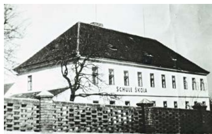
Katovická škola v době II. světové války

Společenský život byl velmi omezen. Od 4. prosince 1944 bylo v Katovicích nařízeno zatemnění od 16 do 7.30 ráno. Stále vycházela nová nařízení. Např. ten, kdo neodevzdal v roce 1944 předepsaný kontingent vajec, měl v roce 1945 zákaz chovat drůbež. Dne 7. ledna 1945 nařídil okresní hejtman Němec Scholz na základě výnosu K. H. Franka, aby byli ze strakonického okresu vysláni muži k práci na obranných výkopech na Moravu. Z Katovic jich mělo odjet 14, nakonec díky různým uděleným výjimkám odjeli jen 3. Od 8. ledna 1945 musela být snížena spotřeba elektřiny o 30 %. Od 23. ledna se rušily rychlíky a spěšné vlaky. Mohlo se cestovat jen do 75 km od domova. Byla také pozastavena balíková pošta, posílat se směly jen obyčejné dopisnice. Koncem ledna začaly deníky vycházet jen 3x týdně a to na jednom listu. Od 13. února nesměl být dobytek krmen bramborami, dokonce bylo nařízeno nařezávat v lesích stromy, aby vypustily smolu, která se poté sbírala pro válečné účely. Tím se lesy ničily. Na rozdíl od předchozích let 15. března 1945 neprobíhaly už žádné oslavy zřízení Protektorátu, dokonce se nedělala ani povinná výzdoba