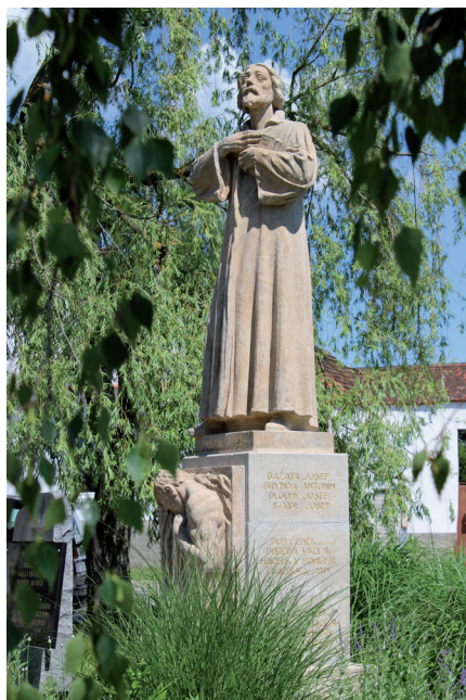
Nově zrekonstruovaný pomník je více než 100 let starý.