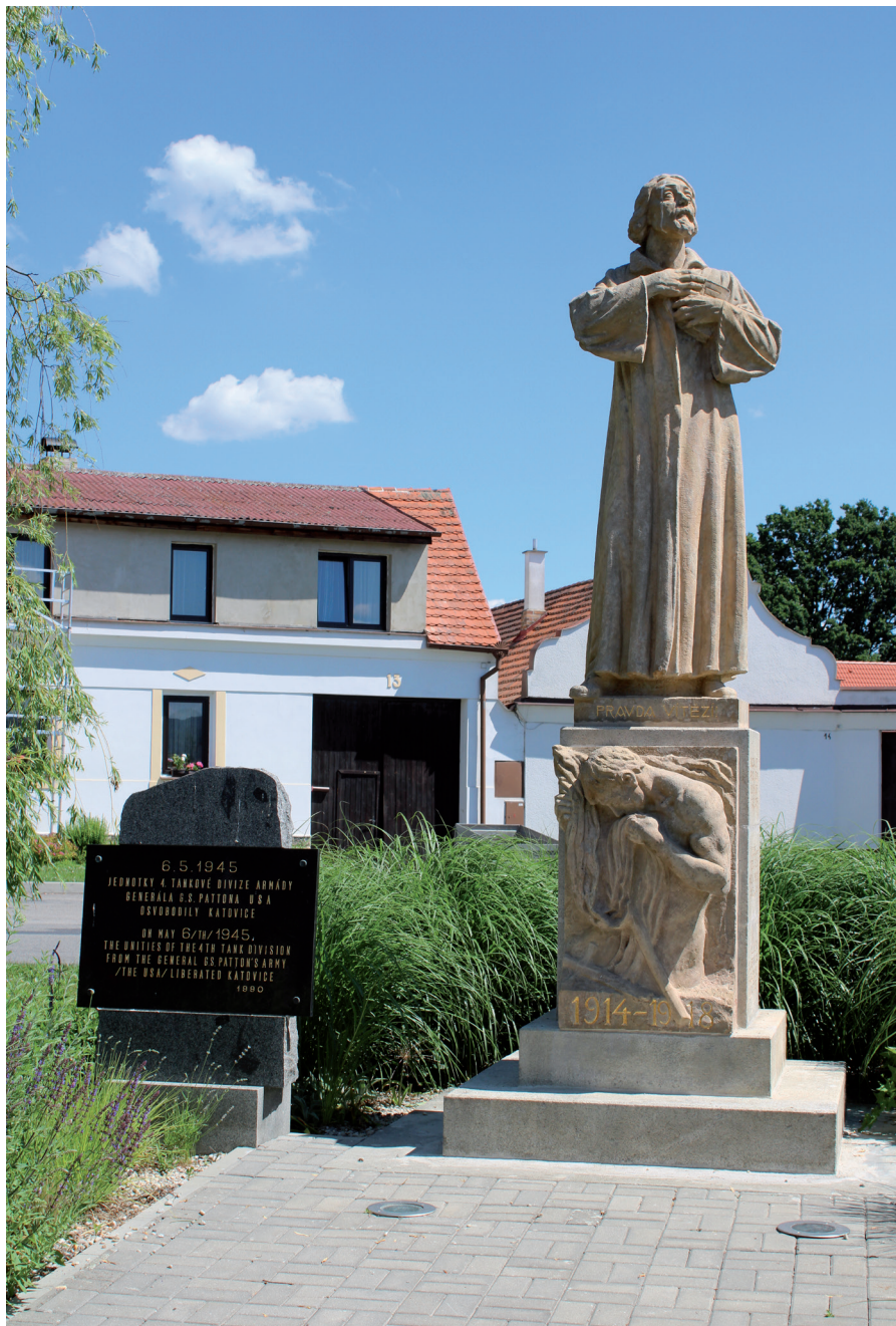
Pískovcový reliéf na čelní straně podstavce