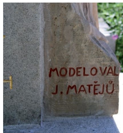
Pomník je signován