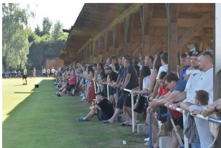
Jihočeské derby v divizi mezi Katovicemi a béčkem českobudějovického Dynama sledovalo neuvěřitelných 494 diváků! Prodal se 170 klobás a vypilo takřka tisíc pív!

V okresním přeboru mladších přípravek pak startovali i nejmenší, kteří se v základní části radovali ze čtyř výher.