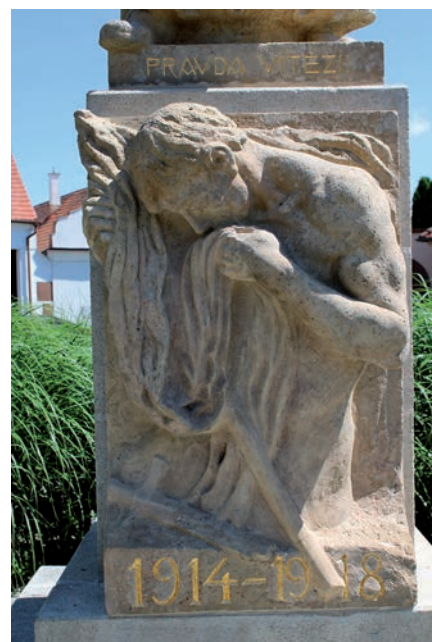
Pomníky na paměť I. i II. světové války na Husově náměstí.