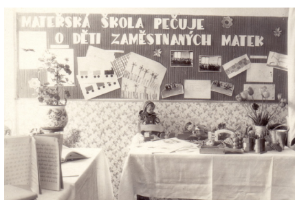
Výstavka MŠ na konci školního roku 55/56

Ve školním roce 1966/67 došlo k zásadní změně v provozní době. Po zavedení volných sobot v továrnách byly zavedeny volné soboty i v MŠ. Nastala i změna ve