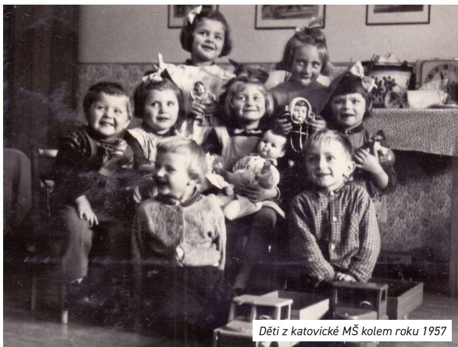
Děti z katovické MŠ kolem roku 1957