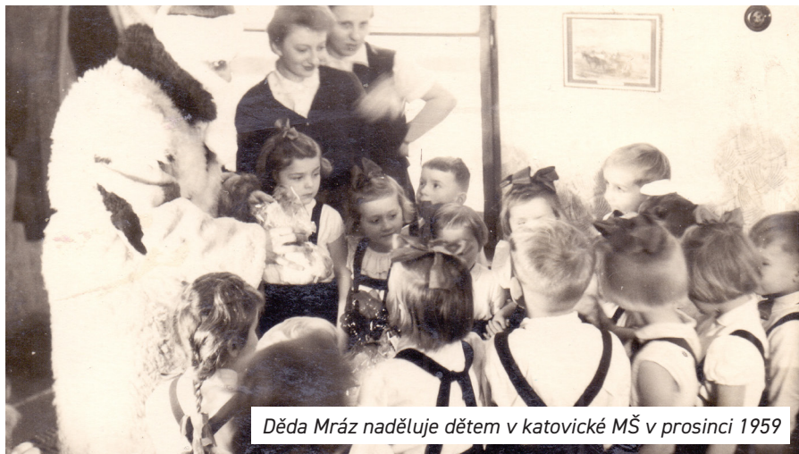
Děda Mráz naděluje dětem v katovické MŠ v prosinci 1959

Ve školním roce 1961/62 nastoupilo 30 dětí, provoz byl upraven na dobu 7 – 17.30