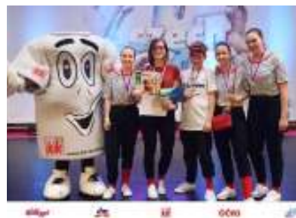
Juniorky, 1. místo Czech Dance Tour, Jindřichův Hradec 30. 3. 2019