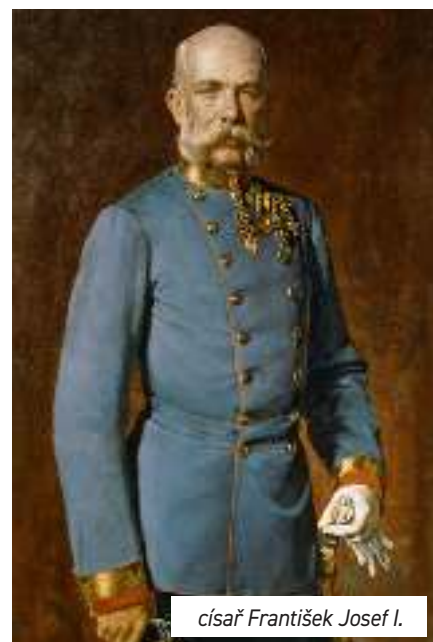
císař František Josef I.

S využitím map se počítalo nejen pro vojenské účely, ale také např. při zakládání dolů, komunikací, splavňování řek atd. Na mapách se zobrazovala jak sídla, tak objekty významné pro orientaci (zříceniny, kříže, boží muka, ...), komunikace (železnice, silnice, úvozové