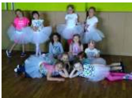
Taneční kroužek od 4 let

Podrobnosti budou včas zveřejněny na https://www.facebook.com/ORIN.cz