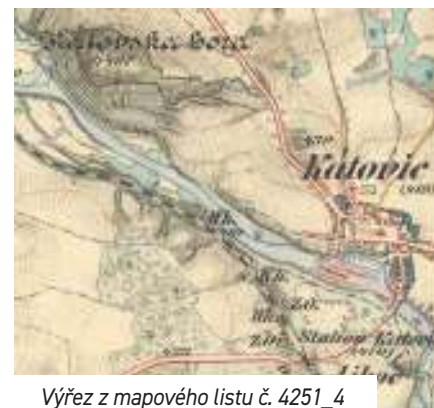
Výřez z mapového listu č. 4251_4