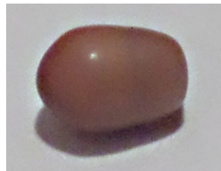
Malá hnědá perlička vylovená v Otavě kolem roku 1946-47