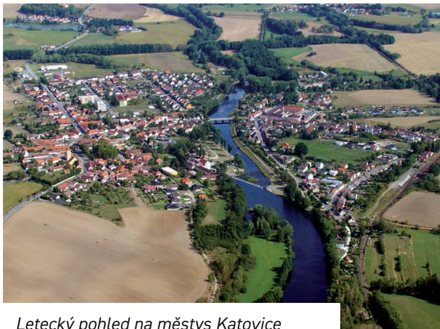
Letecký pohled na městys Katovice

Takže, jak se sami můžete dočíst, intenzivně se připravujeme na jaro a léto a věříme, že se nám podaří podstatnou část akcí zrealizovat. S úklidem okolí