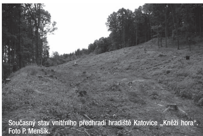
Současný stav vnitřního předhradí hradiště Katovice „Kněží hora“.

V roce 2017 se do popředí vědeckého zájmu dostala opět významná opevněná lokalita Kněží hora. V průběhu června a července proběhla druhá sezóna záchranného archeologického výzkumu hradiště. Účastnilo se jej kromě odborných pracovníků také pět studentů Katedry archeologie z Plzně, kteří zde prováděli průzkum v rámci své letní praxe. Kromě odkryvů byl již v jarních měsících proveden nedestruktivní průzkum hradiště, kdy se podařilo díky průzkumu mapových podkladů a následnému ověření v terénu identifikovat jedno až dvě další předhradí lokality, což ukazuje na jeho značný rozsah nemající v jižních Čechách obdoby.