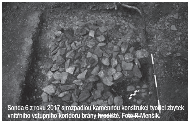
Sonda 6 z roku 2017 s rozpadlou kamennou konstrukcí tvořící zbytek vnitřního vstupního koridoru brány hradiště.

V roce 2017 byla opět potvrzena přítomnost osídlení v období lovců a sběračů v tzv. mezolitu – střední době kamenné (8500 – 5500 před Kristem), kdy se podařilo při archeologickém výzkumu objevit dva kameny upravené štípáním. Malé množství keramických zlomků ukazuje na přítomnost osídlení také v mladších pravěkých obdobích – době bronzové nebo době železné. Největší množství nálezů pocházelo opět z období raného středověku (9. – 10. století), kdy se podařilo v rámci odkryvů odhalit větší množství keramických zlomků zdobených šikmými vpichy nebo vlnicemi, hřebíky, kuchyňský nebo výrobní odpad ve formě zvířecích kostí. Na přítomnost textilní produkce ukazuje nález celého jehlancovitého závaží, které sloužilo jako zátěž vertikálního tkalcovského stavu. Několik keramických zlomků nádob z 15. století svědčí o přítomnosti člověka na katovické hoře i po zániku hradiště. Nálezy budou po výzkumu zpracovány studenty Katedry archeologie v Plzni a po odborném zhodnocení uloženy v muzeu ve Strakoncích.