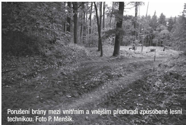
Porušení brány mezi vnitřním a vnějším předhradím způsobené lesní technikou.

Další odběry zeminy pomocí vrtáku ukáží na místa, kde byly aktivity člověka v prostoru hradiště nejvíce rozsáhlé, což může ukazovat například na přítomnost obydlí nebo ustájení domácích zvířat.